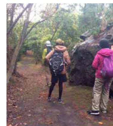
SABOトレッキング（桜島ジオサルク）

おことわり プログラム内容例に記載された3泊4日の日程、訪問先、体験場所、所要時間等については、教育旅行の実施時期、訪問先様の諸事情、交通事情等により変更が生じる場合がございます。あらかじめご了承くださいませ。お願いします。