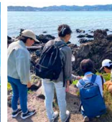
★UDさくらじま★溶岩体感ガイドコース（桜島ジオサルク）