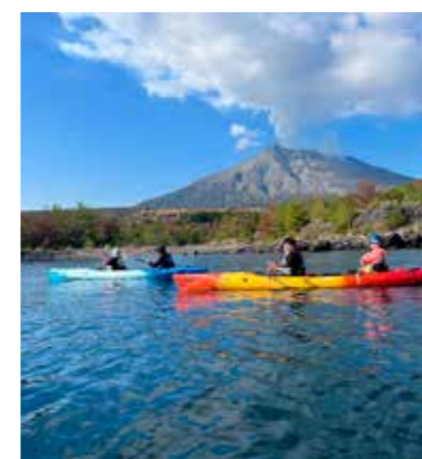
島歩き&プチカヤック体験（かごしまカヤックス）