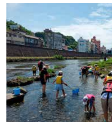
川の自然観察～河川調査隊（重富海岸自然ふれあい館なぎさミュージアム）

おことわり プログラム内容例に記載された3泊4日の日程、訪問先、体験場所、所要時間等については、教育旅行の実施時期、訪問先様の諸事情、交通事情等により変更が生じる場合がございます。あらかじめ了承いただけますようお願い申し上げます。