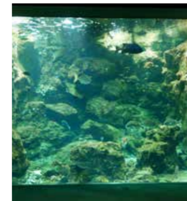
錦江湾水槽（いおワールドかごしま水族館）