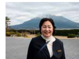
園内ガイドさん（仙巖園）

このプログラムの提供事業者さん/訪問先： 仙巖園 ( https://www.senganen.jp/ ) 桜島ビジターセンター ( http://www.sakurajima.gr.jp/svc/ ) NPO法人桜島ミュージアム ( https://museum.sakurajima.gr.jp ) 桜島ジオサルク事務局( http://s-geo369.main.jp/ ) 維新ふるさと館 ( https://ishinurusatokan.info/ ) 垂水市漁業協同組合 ( http://tarumizugyokyou.com ) NPO法人プロジェクトたるみず ( https://www.minpaku.trmz.jp/ )