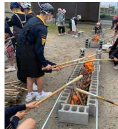
民泊体験（NPO法人プロジェクトたるみず）

* 個別の体験内容の詳細は、体験プログラム集をご参照ください。 ♡ こちらのマークがあるところでは、ユニバーサル対応も行っています。具体的な受入状況については、一度お問い合わせください。