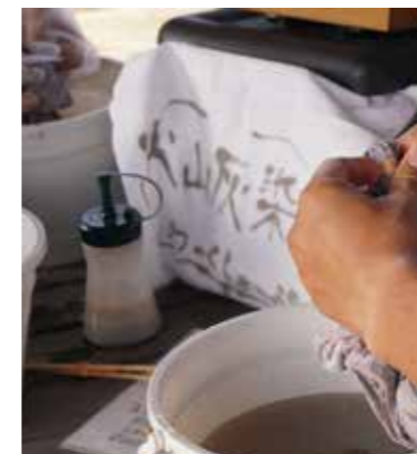
火山灰染め体験（温順人島桜島工房）