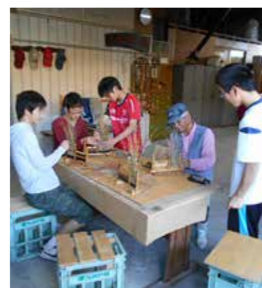
民泊体験（NPO法人プロジェクトたるみず）