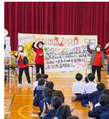
鹿児島弁劇体験（鹿児島県方言文化協会）