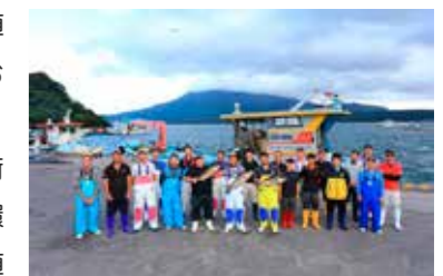
垂水市漁業協同組合の皆さん

垂水市漁業協同組合は養殖業者と共に安全・安心でおいしい魚を提供できるように、漁場に与える環境負荷を軽減する持続的養殖、環境保全のための循環型養殖等、様々な取り組みを続けています。桜島の麓の錦江湾という素晴らしい環境のもとで、カンパチの餌やり体験や加工体験・試食などを通して養殖業の素晴らしさを肌で感じていただければと思います。また、漁協直営の「味処 海の桜勘」では新鮮な海鮮を使った料理を堪能していただけます。