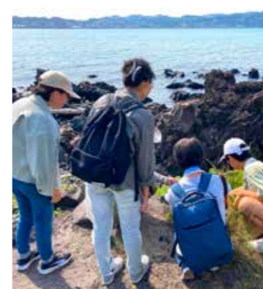
溶岩体感コース（桜島ジオサルク）