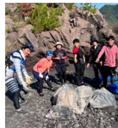
シーカヤックdeビーチクリーン（かごしまカヤックス）

* 個別の体験内容の詳細は、体験プログラム集をご参照ください。 こちらのマークがあるところでは、ユニバーサル対応も行っています。具体的な受入状況については、一度お問い合わせください。