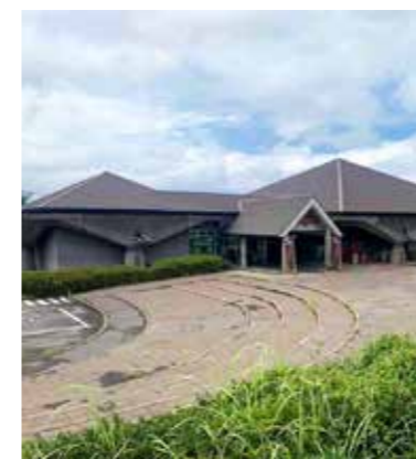
桜島ビジターセンター

* 個別の体験内容の詳細は、体験プログラム集をご参照ください。 🌱 こちらのマークがあるところでは、ユニバーサル対応も行っています。具体的な受入状況については、一度お問い合わせください。