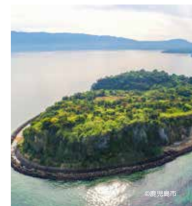
新島ガイドプログラム（ふるさと再生プロジェクトの会）