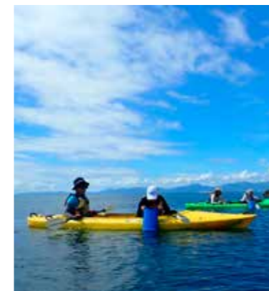
海から桜島を楽しむ3時間ツアー（かごしまカヤックス）

* 個別の体験内容の詳細は、体験プログラム集をご参照ください。 🌱 こちらのマークがあるところでは、ユニバーサル対応も行っていきます。具体的な受入状況については、一度お問い合わせください。