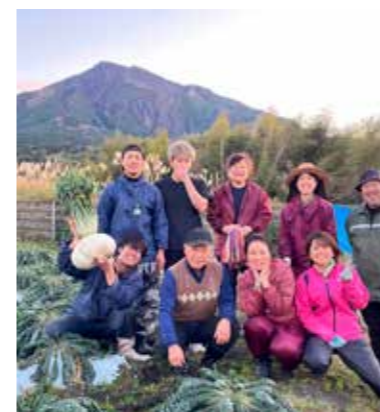
農業体験（ファームランド桜島）