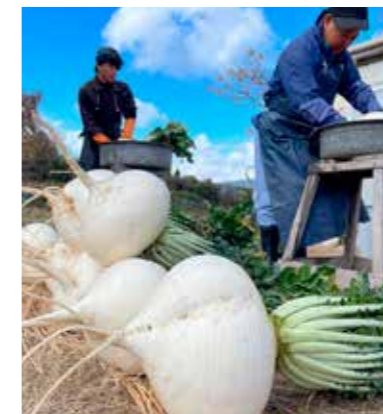
農業体験（ファームランド桜島）