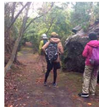
SABOトレッキング（桜島ジオサルク）