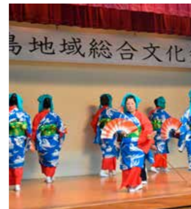
小池島廻り踊りについて講話（小池島廻り踊り保存会）