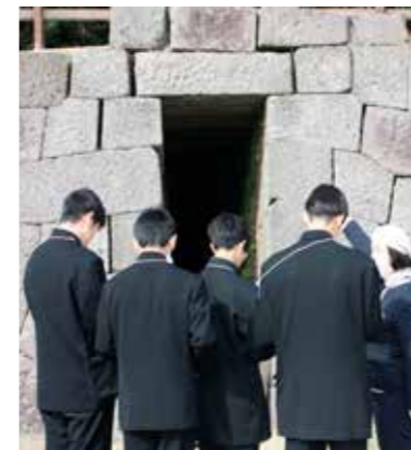
園内ガイドツアー（仙巖園）