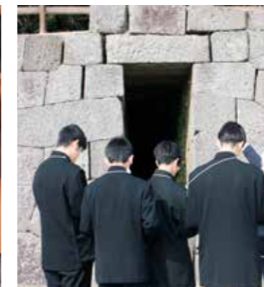
仙巖園・園内ガイドツアー