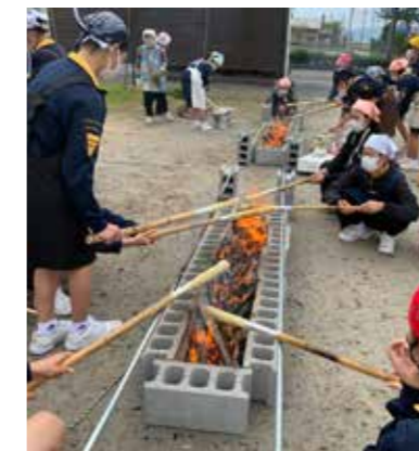
民泊体験（NPO法人プロジェクトたるみず）