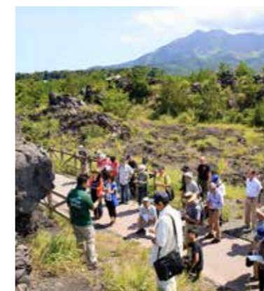
桜島火山体験ツアー（桜島ミュージアム）