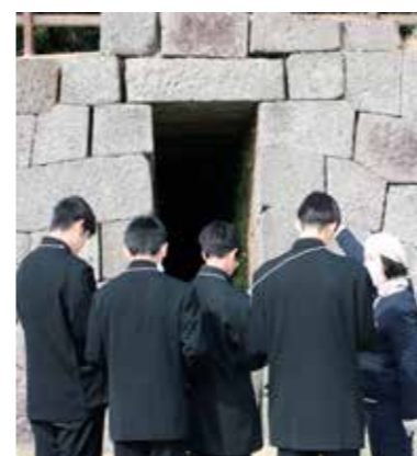
園内ガイドツアー（仙巖園）

* 個別の体験内容の詳細は、体験プログラム集をご参照ください。 ♡ こちらのマークがあるところでは、ユニバーサル対応も行っていきます。具体的な受入状況については、一度お問い合わせください。