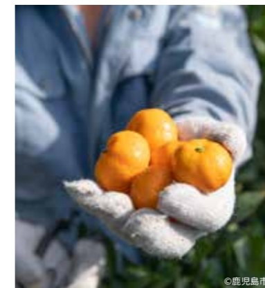
果物狩り体験（吉原果樹園）