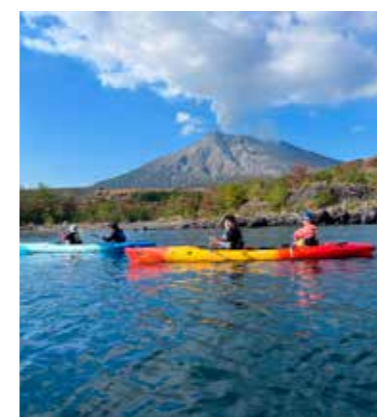
カヤック体験（かごしまカヤックス）