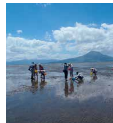
錦江湾の生き物観察ツアー（重富海岸自然ふれあい館なぎさミュージアム）