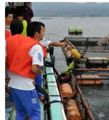
漁業体験（垂水市漁業協同組合）

* 個別の体験内容の詳細は、体験プログラム集をご参照ください。 こちらのマークがあるところでは、ユニバーサル対応も行っていきます。具体的な受入状況については、一度お問い合わせください。