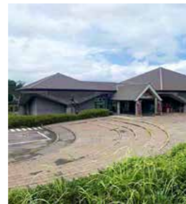
桜島ビジターセンター

* 個別の体験内容の詳細は、体験プログラム集をご参照ください。 こちらのマークがあるところでは、ユニバーサル対応も行っています。具体的な受入状況については、一度お問い合わせください。