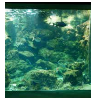
錦江湾水槽（いおワールドかごしま水族館）