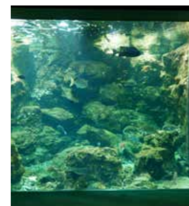
錦江湾水槽（いおワールドかごしま水族館）